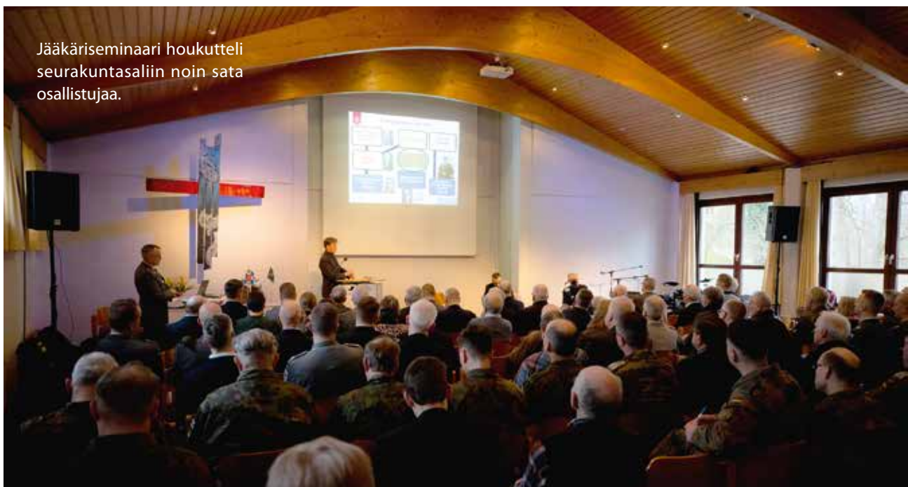
Jääkäriseminaari houkutteli seurakuntasaliin noin sata osallistujaa.