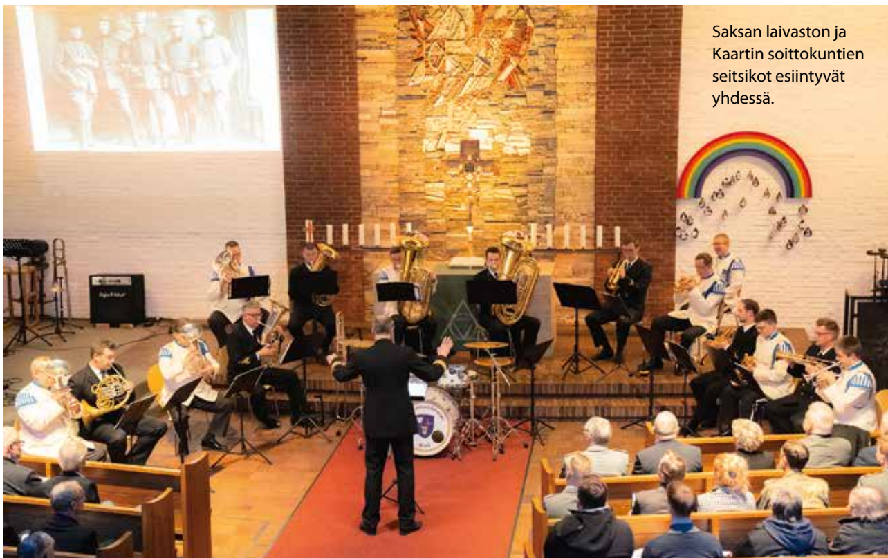
Saksan laivaston ja Kaartin soittokuntien seitsikot esiintyvät yhdessä.