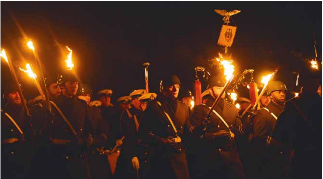
Vaikuttava Großer Zapfenstreich -kunnianosoitus järjestettiin Puolustusvoimain komentajan virallisen vierailun ja jääkärikoulutuksen alkamisen 110-vuotisjuhlapäivän kunniaksi.

onnistuivat erinomaisesti. Tilaisuuksissa kunnioitettiin upeasti jääkärien meille jättämää perintöä ja esimerkiksi rohkeudesta, toveruudesta, epäitsekkyydestä ja isänmaallisuudesta.