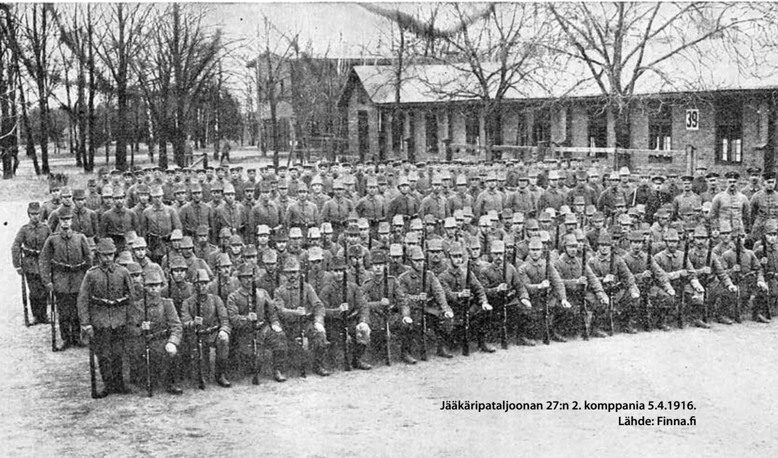
Jääkäripataljoonan 27:n 2. komppania 5.4.1916.