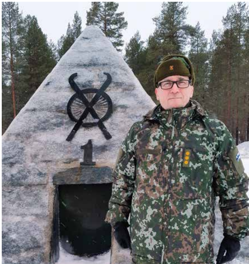
Kirjoittaja toimi Lapin jääkärien pääkouluttajana vuosina 1996–1999 ja vaalii nykyään jääkäriperinteitä Lapissa. Taustalla tuulahdus jääkärihenkeä Joutselästä, Terijoen kupeelta. 25.2.2025 harjoituksen lopuksi.