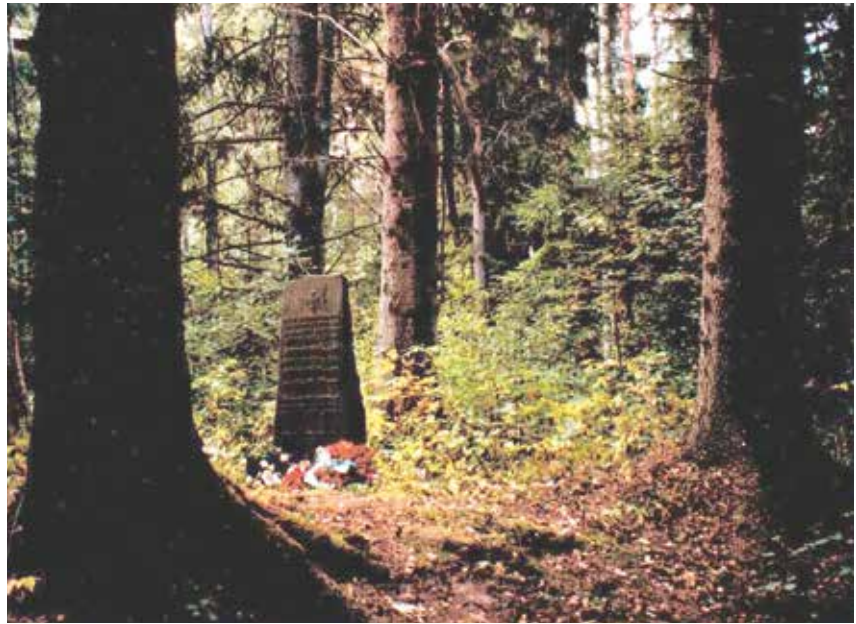
Gallingan jääkärihauta vuonna 1996.

Vuonna 2015 kiersimme pienen kortesjärveläisen ryhmän kanssa