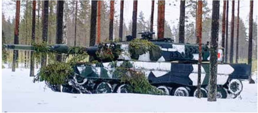
Valmiusyksikön tulivoimaa edustava Leopard 2 A 4 on yllättävän hiljainen ja näkymätön taistelukentällä huolimatta 55 tonnin painostaan. Tulivoimaa edustaa 120 mm kanuuna.