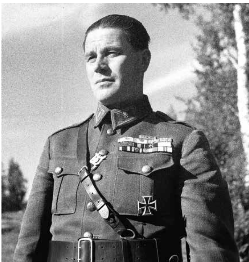
Uno Fagernäs. Jääkärikenraalimajuri Uno Fagernäs Talvisodassa 1943

Sotilaslääniin aluejako rakentui muutamin poikkeuksin vahvasti siviililääniin aluejaon mukaan. Vaasan läänin alue muodosti siten vastaavan sotilaslääniin alueen – sotilaslääniin nimi vain vaihteli ajan myötä.