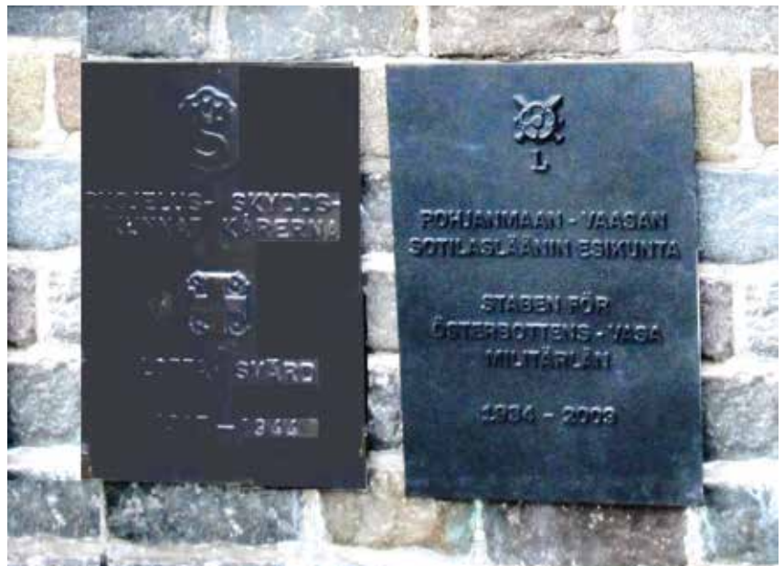
Sotilasläänin laatta sai sijoituspaikan Suojelus kuntien ja Lotta Svärd -järjestön muistolaatan rinnalta. Järjestöt olivat vuoteen 1944 tiiviissä yhteistyössä (IV)