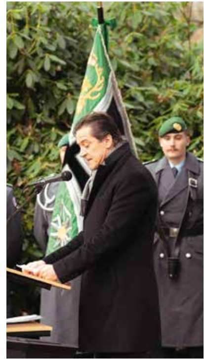
Suomen suurlähettiläs Saksassa Kai Sauer piti puheen Ehrenhainin muistomerkkialueella.