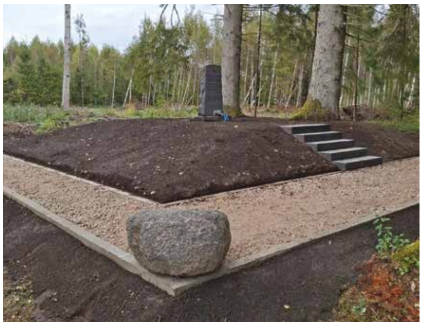
Jääkärihauta lokakuussa 2024.