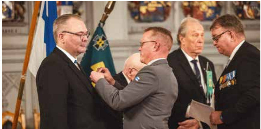
Kannuksen kaupunginjohtaja ja entinen puolustusministeri Jussi Niinistö palkittiin tilaisuudessa. Kiitospuheessaan hän muistutti jääkärien merkityksestä Suomen itsenäisyydelle.