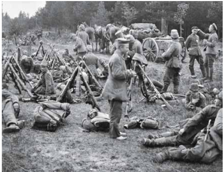
Jääkärien lepoetki elokuussa 1916 pataljoonan siirtyessä Misse-joelta Riianlahden aseisiin.

Jääkäreillä värväys oli usein sivutoimi, sillä heidän varsinainen tehtävänsä oli tietojen hankkiminen venäläisten sotilaallisesta toiminnasta Suomessa.