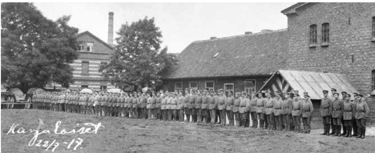
Jääkäripataljoona 27:n karjalaiset yhteiskuvassa Libaussa Latviassa 22.7.1917. Huomaa kuvan alareunassa valkoinen teksti "Karjalaiset".