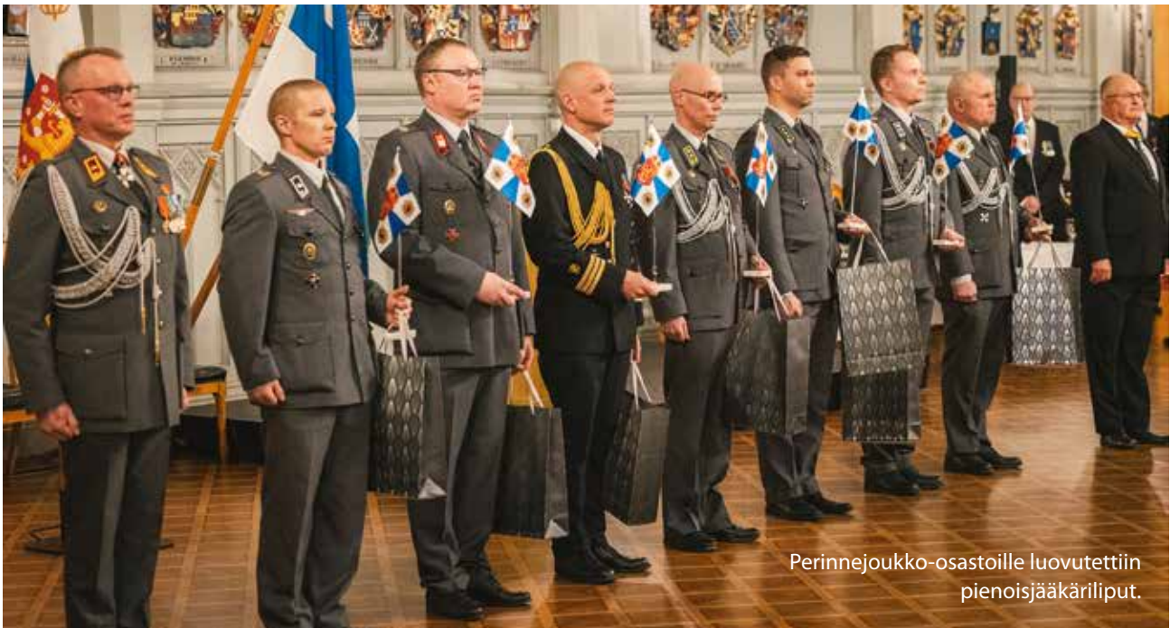
Perinnejoukko-osastoille luovutettiin pienoisjääkäriliput.