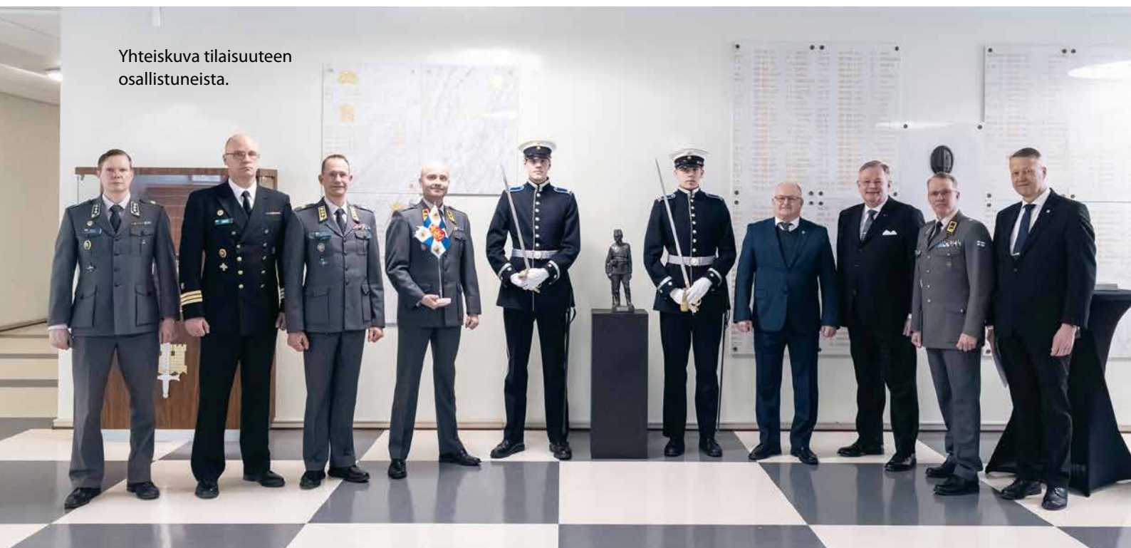
Yhteiskuva tilaisuuteen osallistuneista.

koulun johtaja Jääkäripienoispatsaan. Lämminhenkisen tilaisuuden puheenvuoroissa todettiin yhteisesti, että luovutetut symbolit ovat tärkeä muistus upseerikoulutettaville jääkärien esimerkin ja elämäntyön merkityksestä Suomen itsenäisyydelle.