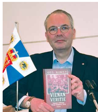
Entinen puolustusministeri Jussi Niinistö esitelmöi uudesta kirjastaan Jääkäripataljoona 27:n Satakunnan osaston 40-vuotisjuhlassa viime vuoden marraskuussa Porissa.