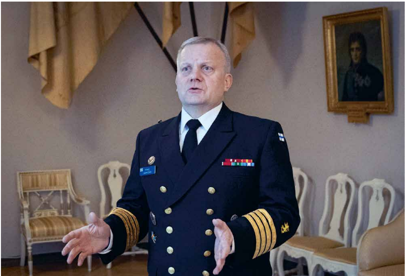
Kommodori Mikko Laakkonen on ollut tyytyväinen ensimmäiseen vuoteensa Uudenmaan prikaatin komentajana, jonka aikana hän on muun muassa suorittanut prikaatin kunnianhimoisen barettimarssin.

Juttu on julkaistu myös Ruotuväen nettijulkaisussa 22.1.2026