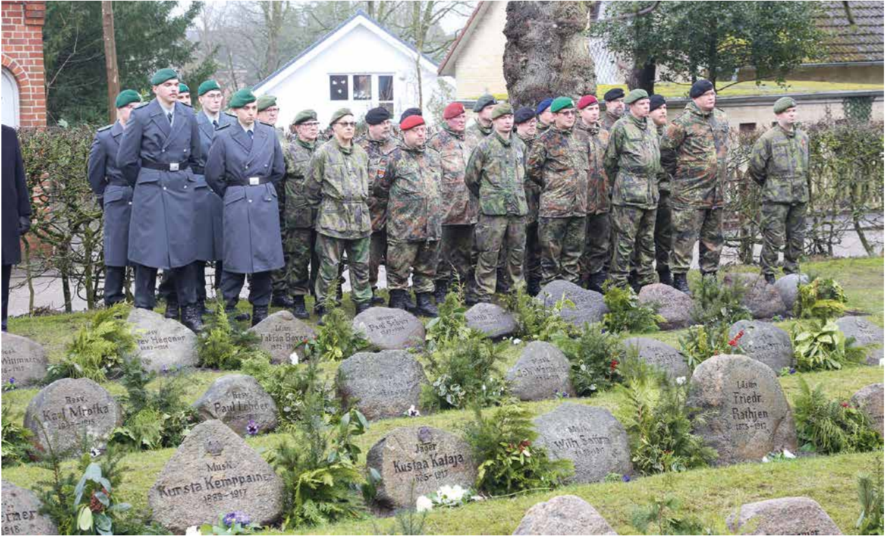
Suomalais-saksalainen reserviläisosasto Kellinghusenissa.