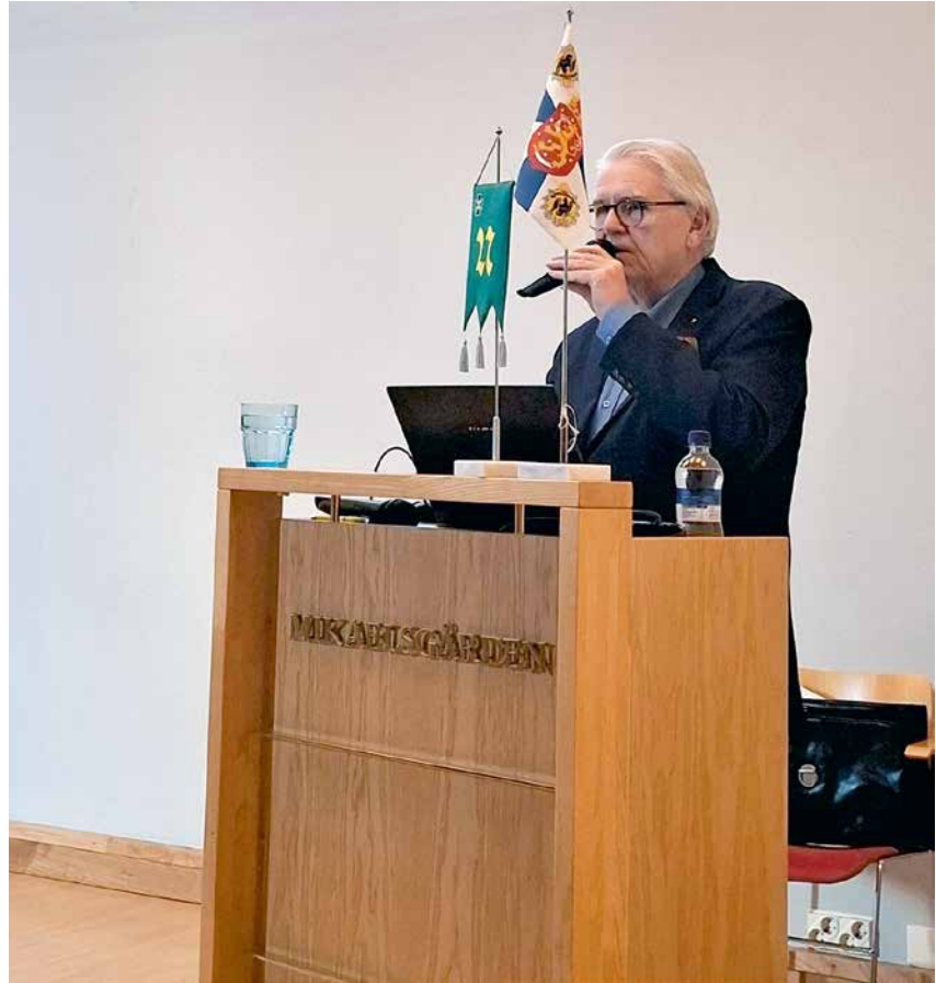
Kirjailija Lasse Lehtinen alusti Suomen kohtalonhetkistä ja sivusi esitelmässään myös jääkäriiliikettä Mikaelsgårdenin juhlasalissa Porissa viime lokakuussa.