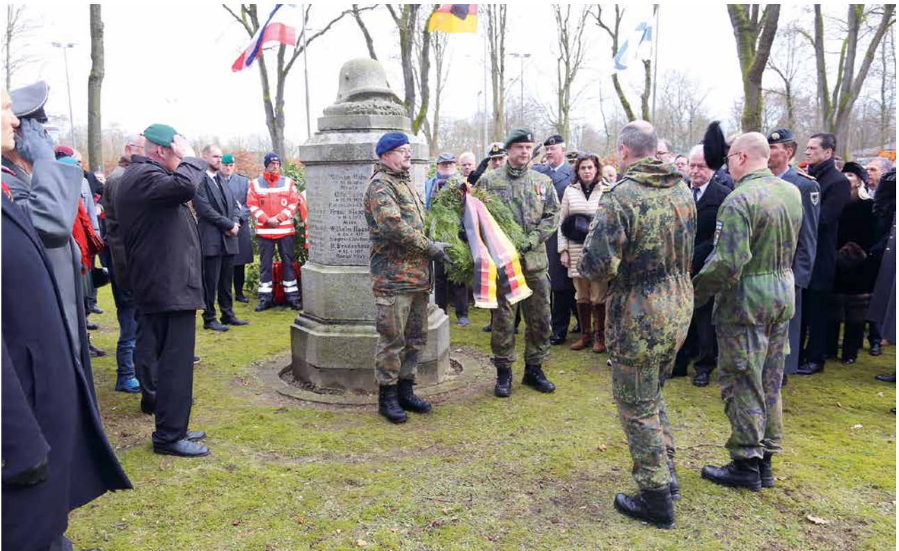
Reserviläiset laskevat seppeleen 1. maailmansodan muistomerkillle.