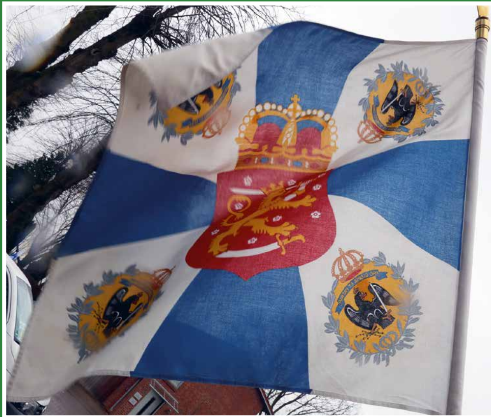
Jääkärilippu liehui Finnentag-juhlissa Hohenlockstedtissä.