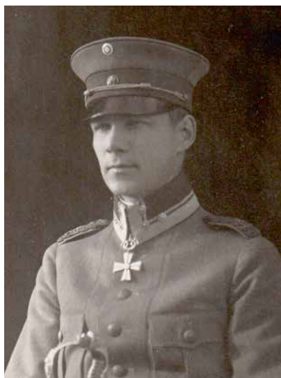
Hyökkäysvaunurykmentin komentaja jääkärieversti Aarne Sihvo.

Hyökkäysvaunurykmentti perustettiin heinäkuussa 1919 ja sen sijoituspaikaksi tuli Santahamina. Sijaintipaikkaa perusteltiin sillä, että haluttiin turvata pääkaupungin puolustus ja