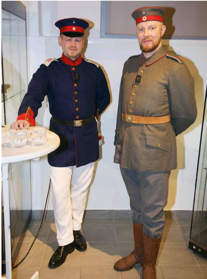
Jääkäriunivormuja esiteltiin Hohenlockstedtissä.